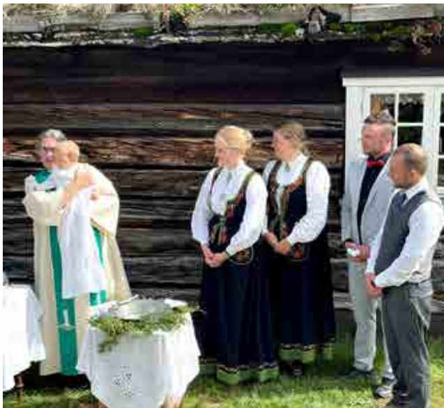
Presentasjon for menigheten: Presten presenterer dåpsbarnet for menigheten og utroper denne til et nytt medlem av vår flokk. Menigheten bes om å ta godt imot barnet og familien og huske dem i deres bønner.