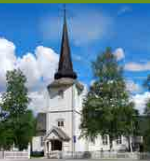
Øvre Rendal kirke