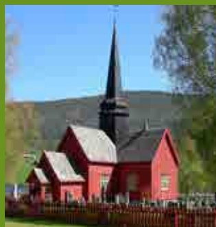
Ytre Rendal kirke